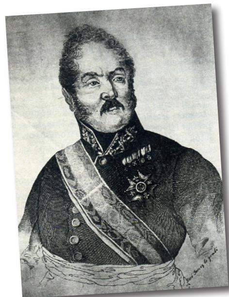
Retrat de Carlos de España gravat per José Gómez. L'il·lustrador reflecteix la cara trasmudada del comte, amb mirada agressiva i posat inquisidor.

Va fer arrestar la seva dona perquè un dia no li havia cuinat moniacos per dinar. Tot per mor que havien prohibit l'entrada d'un venedor de verdura a la Ciutadella i la pobra Dionísia no n'havia pogut comprar. No va valer l'excusa per salvar-se de l'arrest.