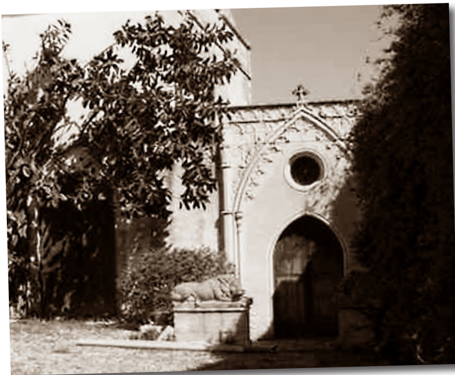
Capella neogòtica de les cases de Defla, datada de l'any 1862, on hi ha el sepulcre de marbre amb el cos, finalment sencer, del primer comte d'Espanya.

Tornant a les possibilitats literàries del personatge, a hores d'ara no hi ha notícia d'aparicions d'un cavaller decapitat colcant amb un cavall negre que tragués foc pels ulls i el nas, pels entorns de Defla. La llegendaria mala fama postmortem dels nostres comte Mal o comte Arnau no s'ha transvasat al record del comte d'Espanya, per ventura perquè hi ha vegades que d'un bon tros la realitat supera la ficció.